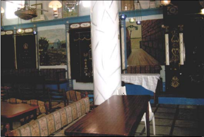
די ביהמ"ד פון מהר"י אבוהב ותלמידו מרן הבית יוסף אין צפת

דאן האבן די אידן געזעהן פאר פאסיג ארויפצוגיין אין די מאסן זיך באזעצן אינעם לאנד אשר ה' דורש אותה תמיד, און מ'האט אנגעהויבן צו צוזאמנעמען די נדחי ישראל וועלכע זענען געווען צושפרייט בכל מקומות מושבותיהם, און די טערקן האבן זיך אויפגעפירט זייער שייך צו די אידן און זיי אויפגענומען בסבר פנים זיך צו באזעצן אין ארץ ישראל מיט א מנוחה והשקט.