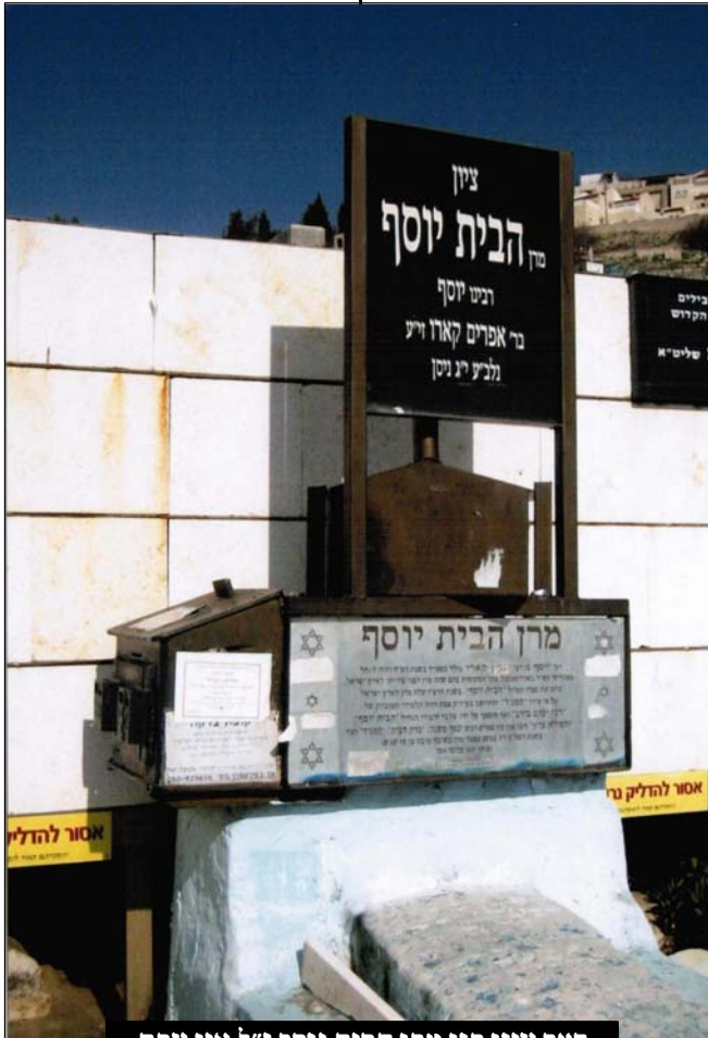
דער ציון פון מרן הבית יוסף ז"ל אין צפת

דא האט אויפגעפלאקערט א גרויסע מחלוקה צווישן די גדולים פון