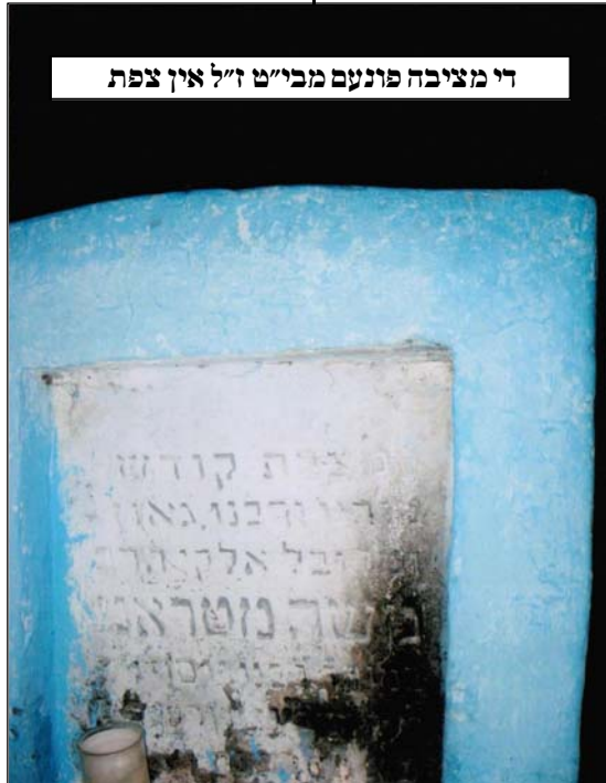
די מציבה פונעם מבי"ט ז"ל אין צפת

איז איינגעפאלן פאר די גדולים וחכמים צו באנייען די ענין פון "סמיכה" וואס איז געווען אין די צייטן פון בית המקדש אין די תקופה פון די זמן התלמוד, ד.מ. אז בי"ד וועט האבן די מעגליכקייט צו מאכן תקנות ביי אידן, צו דן זיין אין עניני ממונות בכל תוקף, און אזוי אויך צו שטראפן פאר די וואס פאלגן נישט אויס דעם פסק, די זעלבע זאך אויך מקדש צו זיין די חדשים און מעבר זיין די יארן א.א.וו.