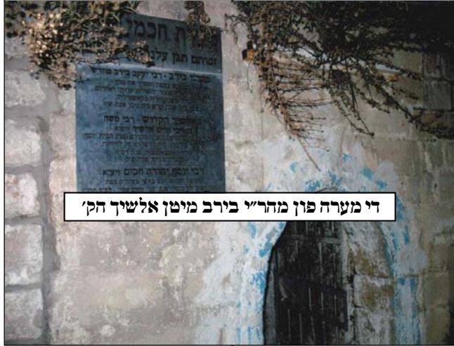
די מערה פון מהר"י בירב מיטן אלשיך הק'

מ'קען נישט אריבער מישן די היסטאריע בלעטל אן צו דערמאנען די שטורמישע מחלוקה וואס האט דאן אויסגעבראכן צווישן די גדולי ישראל די ניי געקומענע עולים פון ספרד, און אגב זעהט מען פון דעם די גרויסקייט פונעם ישוב וואס האט זיך שטארק צוואקסן אין לויף פון די געציילטע יארן בכמות און ספעציעל באיכות.