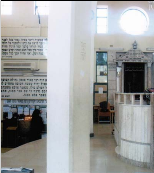
דער ציון פון רבי מאיר בעל הנם

בימים ההם האט זיך שייך אנטוויקלט די מסחר און דער עקאנאמישער מצב הפרנסה אין מדינת טערקיי, און די אידן דארט זענען זייער רייך געווארן, אזוי ווייט אז פון פארשידענע געגנטער און דערפלעך ארום דעם ים התיכון האט מען אלעס איבער געלאזט און געקומען וואוינען קיין טערקיי.