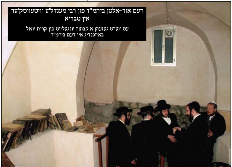
דעם אור-אלטן ביהמ"ד פון רבי מענדל'ע וויטעווסק'ער אין טבריא עס ווערט געזעהן א קבוצה יונגעלייט פון קרית יואל באזוכנדיג אין דעם ביהמ"ד

מעלה, אלעס וואס האט זיי געפעלט האבן די בני חו"ל זיי צוגעשטעלט, די בני חו"ל האבן אמת'דיג געזארגט פאר אלע זייערע געברויכן מיט א ספעציעלע איבערגעגעבנקייט, און אזוי האבן זיי געדינט דעם באשעפער און זענען נתעלה געווארן אין רוחניות ביתר שאת וביתר עוז.