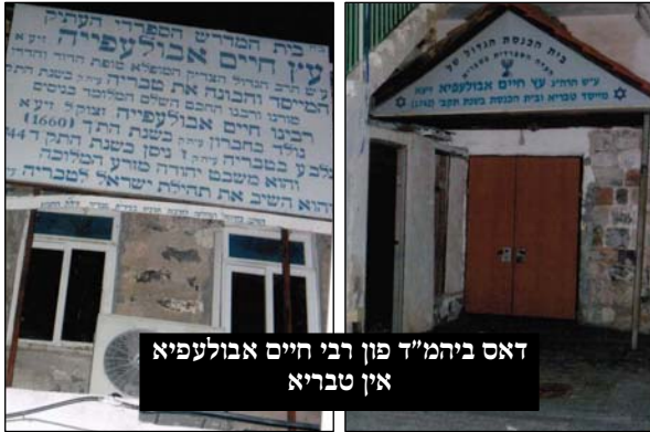
דאס ביהמ"ד פון רבי חיים אבולעפיא אין טבריא

אריבער קיין טבריה מיט א גרויסער טייל פון די בני החבורה, און רבי אברהם קאליסק'ער איז געבליבן וואוינען אין צפת נאך א שטיק צייט, און שפעטער איז ער אויך נאכגעקומען און ער האט זיך אויך מצטרף געווען צום נייעם ישוב אין די שטאט טבריה. טבריה איז דאן געווען אזויווי די גאנצע גליל, קליינע קבוצות פון די קהילות הספרדים און אסאך ישובים וואס זענען געווען אויסגעליידיגט פון איינוואוינער, מיט דרייסיג-פערציג יאר בעפאר האט געוואוינט דארט הרה"ק רבי חיים אבולעפיא וועמען מ'האט גערופן מיטן טיטל "בונה טבריה", און צוזאמען מיט נאך צענדליגע יונגעלייט האט מען אנגעהויבן צו ארויף ארבעטן און אויפבויען פון דאסניי דער ישוב צו בויען נייע דירות וכו'.