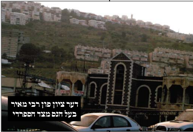
דער ציון פון רבי מאיר בעל הנס מצד הכפרדי

שם בארץ ישראל כל קהל וקהל וכו'. און עס איז גע'חתמ'ט געווארן "ראש חודש אדר שס"א לפ"ק פה וויניצא" פון דא זעהן מיר די מקור פון די