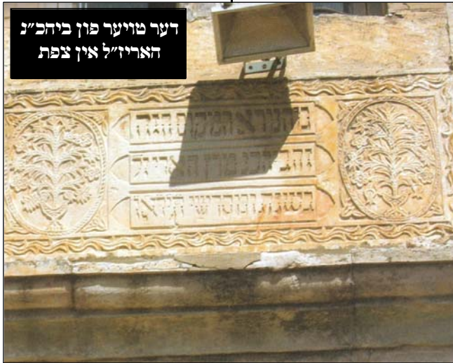
דער טויער פון ביהכ"נ האריז"ל אין צפת

היינט וועט ער קענען אנגענומען ווערן צווישן זיינע תלמידים, דער אר"י הק' האט איהם צוגעלייגט: "וויסן זאלסטו אז איך בין נישט אראפ געקומען אויף די וועלט