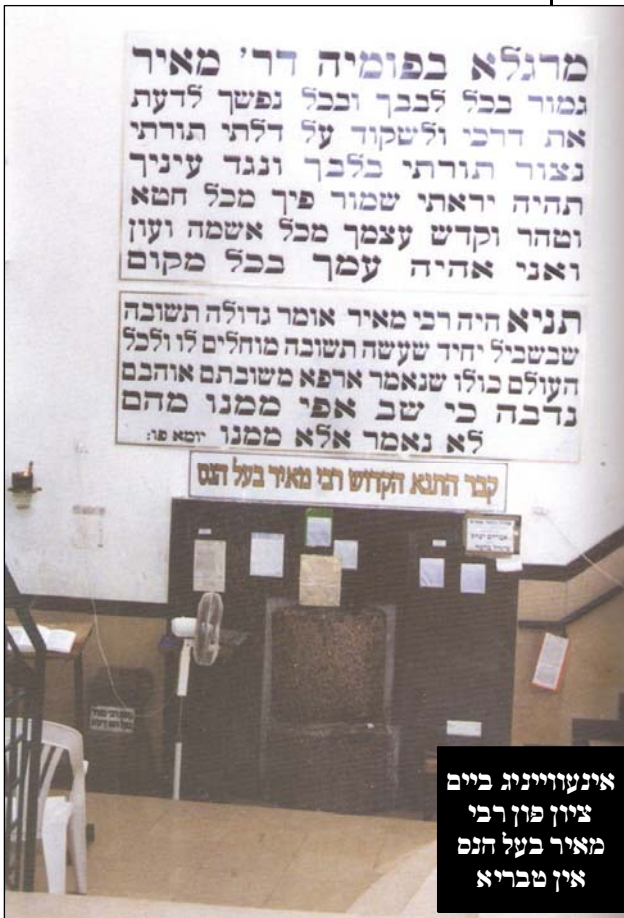
איבערזייניג ביים ציון פון רבי מאיר בעל התם אין טבריא

למעשה איז דעמאלטס געגרינדערט געווארן ביי די אשכנזים איין פושקע מיטן