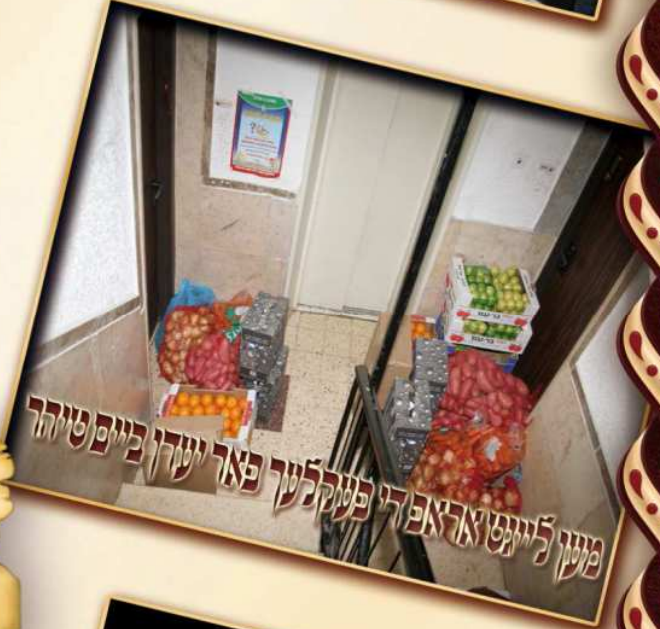
מען רייגט אראפ די פטקלעך פאר ישרון ביים טיהר

דעריבער אצינד ווען עס קומט אצינד פאר די גרויסארטיגע מגבית לטובת די מפעל קמחא דפסחא, איז צו האפן אז די ציבור חשוב וועט זיך באטייליגן בגוף ובמזון און צוהעלפן במוטב היכולת צו די שווערע הצאות פונעם חשובין מפעל, און אין דעם זכות וועט איהר זיכער זוכה זיין צו כל הברכות האמורות בתורה.