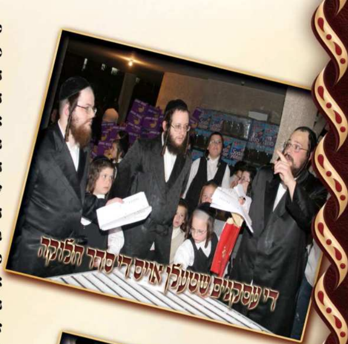
די עסקנים שטעלן אויס די סדר הלוקה

קענען אפרעכטן די חג הפסח מיט פרייד און מיט אַ עונג יו"ט, העלפט אונז צו העלפן די חשובע אינגעלייט און בעה"ב נצרכים וואס האבן נישט מיט וואס יו"ט צו מאכן, שטרעקט אויס אייעהר ברייטע שטיצע בעין יפה וברוח נדיבה, און נעמט אַ חלק אין באלייכטן הימישע אידישע משפחות אויף יו"ט פסח, ווי שטארק גליקליך וועט איהר זיך שפירן בליל התקדש החג זיצנדיג ביים סדר טיש כבני חורין ביים זאגן אין די הגדה "כל דכפין ייתי וייכול, כל דצריך ייתי ויפסח".... וויסנדיג אז נאך אפאר משפחות זיצן און רעכטן אפ דעם סדר נאכט אין אייער זכות און מיט אייעהר הילף, די זכות איז דאך זיכער געוואלדיג גרויס עד אין לשער.