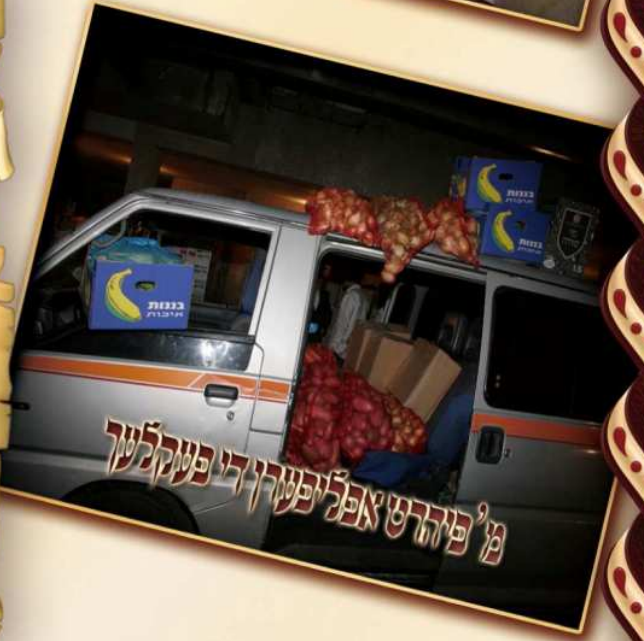
מ'פיהרט אפ' ישרון די פטקלעך