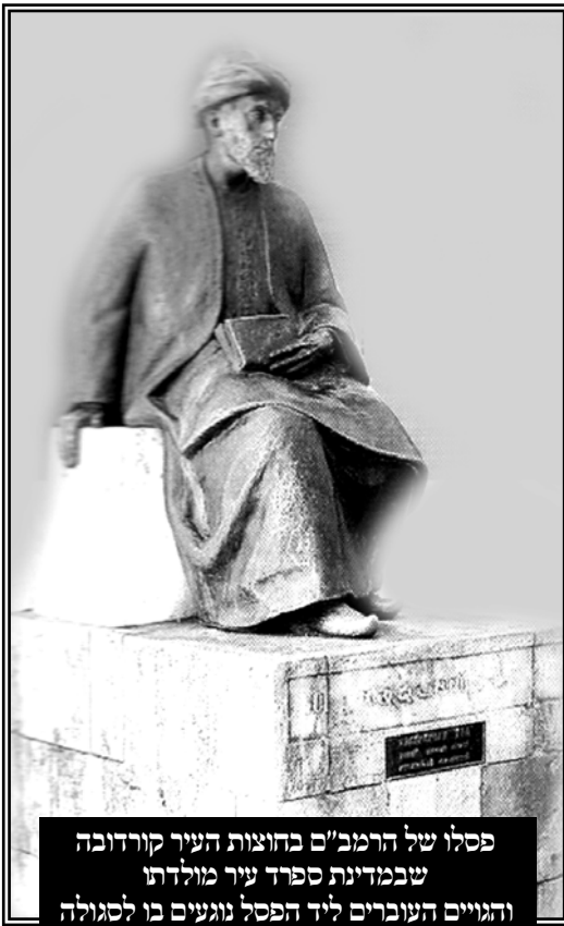
פסלו של הרמב"ם בחוצות העיר קורדובה שבמדינת ספרד עיר מולדתו והגויים העוברים ליד הפסל נוגעים בו לסגולה

דירושלים ז"ל, דיין המצויין דק"ק פ"ב ז"ל, ובפסקיו אשר עודם בכתובים - השאילים לי בטובו הרב הגאון בנו אב"ד דק"ק יערגין נ"ו כתב שם באמצע שו"ת אחת, היה רע עלי המעשה מה שעשו בק"ק סערדאהעלי, שלאחר שמת הגאון הרב ר' יהודה אסאד זלה"ה, היה מעמידין אותו וציירו אותו, למען יוכלו למכור צורתו, ועבירה גדולה היא, דמת אסור בהנאה, ותמיהני מה שנוהגים שמוכרים השכיבה של צדיק, ואיך יכולים להנות מזה, הלא מת אסור בהנאה, והם נהנים מן המת בזה, אולי זה בכלל מצוה, דהמענות