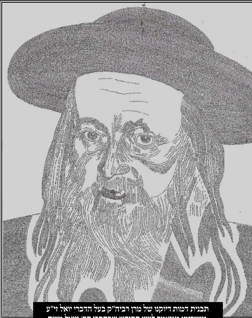
תבנית דמות דיוקנו של מרן רביה"ק בעל הדברי יואל זי"ע משורטט ממאמר לשון הקודש שבספרו הק' ויואל משה