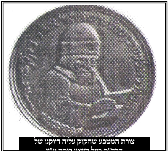
צורת המטבע שחקקו עליה דיוקנו של הרה"ק בעל השמן רוקח זי"ע

כידוע חקקו במדינת האללאנד מטבעות עם דמותו של הגאון רבי אלעזר רוקח זצ"ל בעל השמן רוקח, שכפי שמסופר הגיע ג' ימים לפני ר"ה שנת תצ"ו מעיר בראדי לכהן פאר כאב"ד באמסטערדאם, ומיד בהגיעו אירע נס גדול כי תושבי העיר היו סובלים משרצים ורמשים שכילו את פירותיהם ומזונם, ומיד בהגיעו נסתלקו מבלי השאיר שריד ופליט, וכולם ראו שאיש קדוש עובר לפניהם, ומרוב השתוממות והתפעלות חקקו מנהיגי המדינה מטבע עם דיוקנו הקדוש, אשר עליו כתוב 'צורת רבי אלעזר בן הרב ר' שמואל אב"ד דקהילה קדושה בראדי', ומצדו השני יש פסקי תהלים, ויום עשיית המטבע ביום כ"ז אלול תצ"ה לפ"ק, ויש לציין שכפי שמקובל לא השתמשו עם המטבע לצורך מסחר, רק לאות הוקרה, וכמובן שברור הדבר שהוא נעשה ללא רשותו או הסכמתו של הגאון הקדוש הנ"ל.